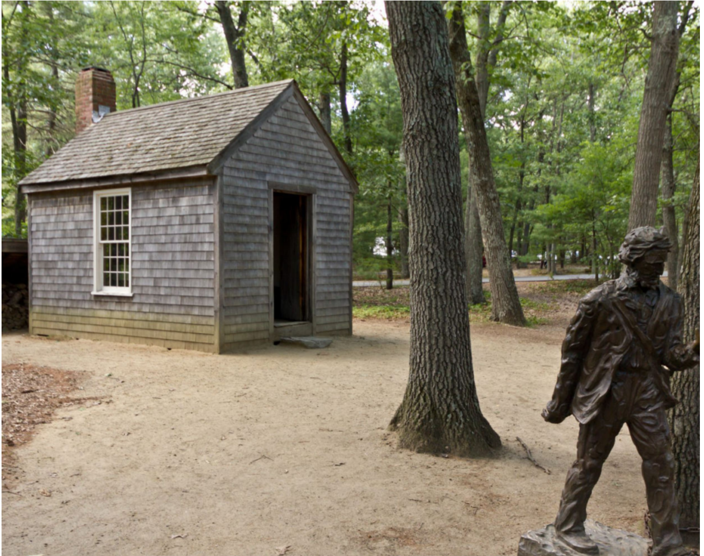
Cabaña de Thoreau

Durante un viaje que Thoreau hizo a Concord en julio de 1846, el alguacil lo detuvo y encarceló por no pagar un impuesto de capitación que se negaba a pagar porque apoyaba a una nación que respaldaba la esclavitud . Ante el leve escándalo suscitado por este gesto contra la autoridad, Thoreau defendió sus acciones en una conferencia pronunciada en el Concord Lyceum, en la que expuso públicamente sus razones para resistirse a la autoridad estatal. Más tarde revisó y publicó esta conferencia con el título de Desobediencia civil , que es la más conocida internacionalmente de las obras de Thoreau, y que inspiró a destacados