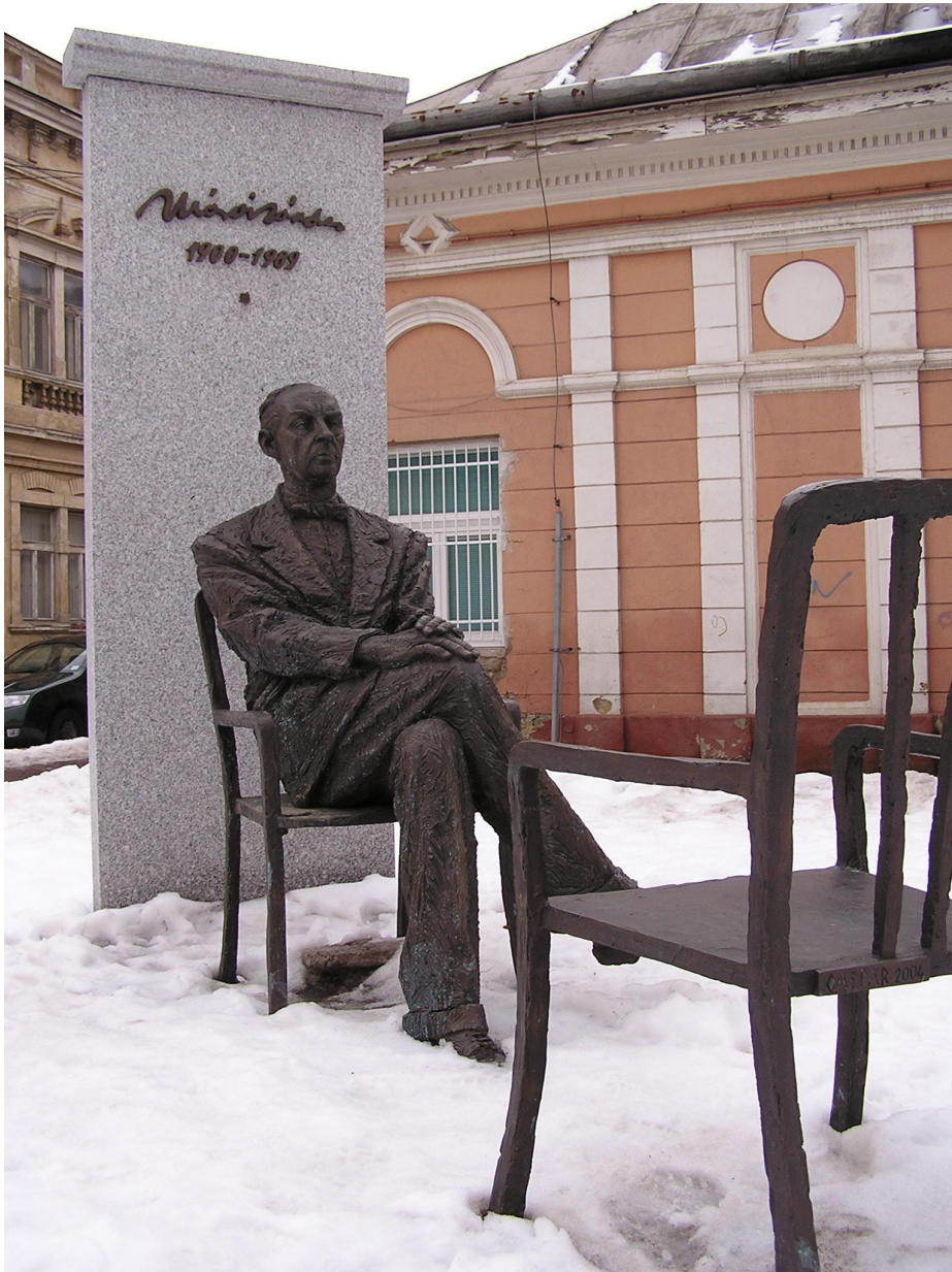
Monumento a Sándor Márai en Budapest