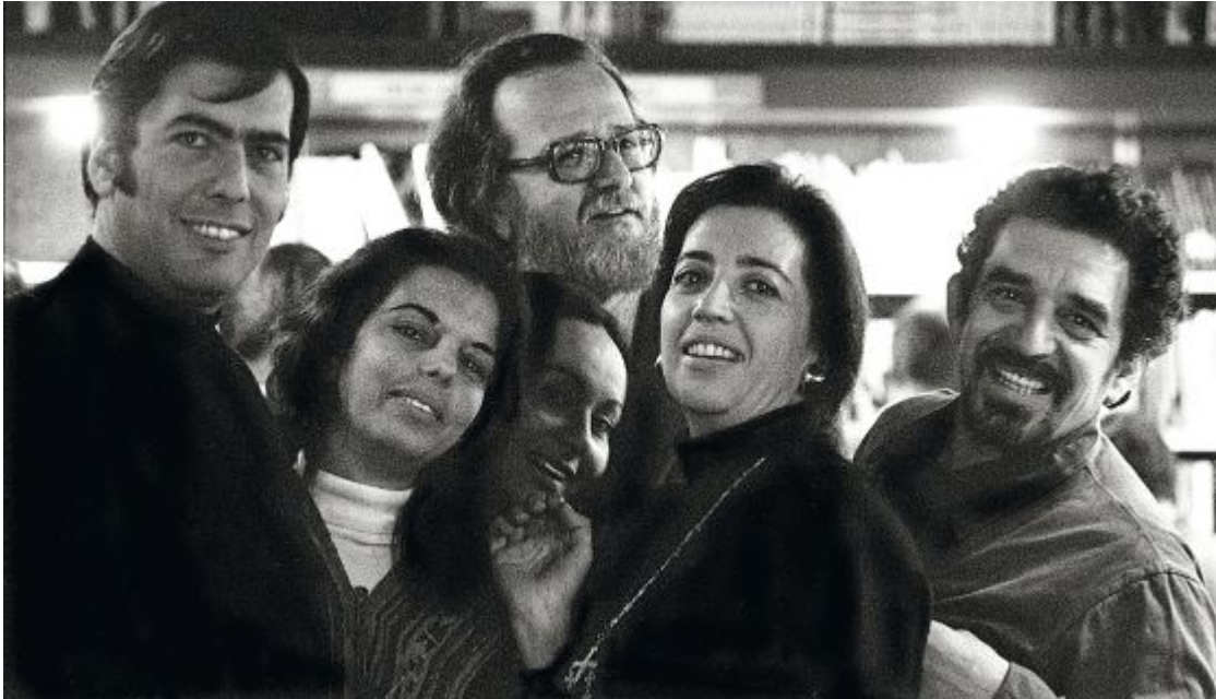
Mario Vargas Llosa y García Márquez fueron grandes amigos