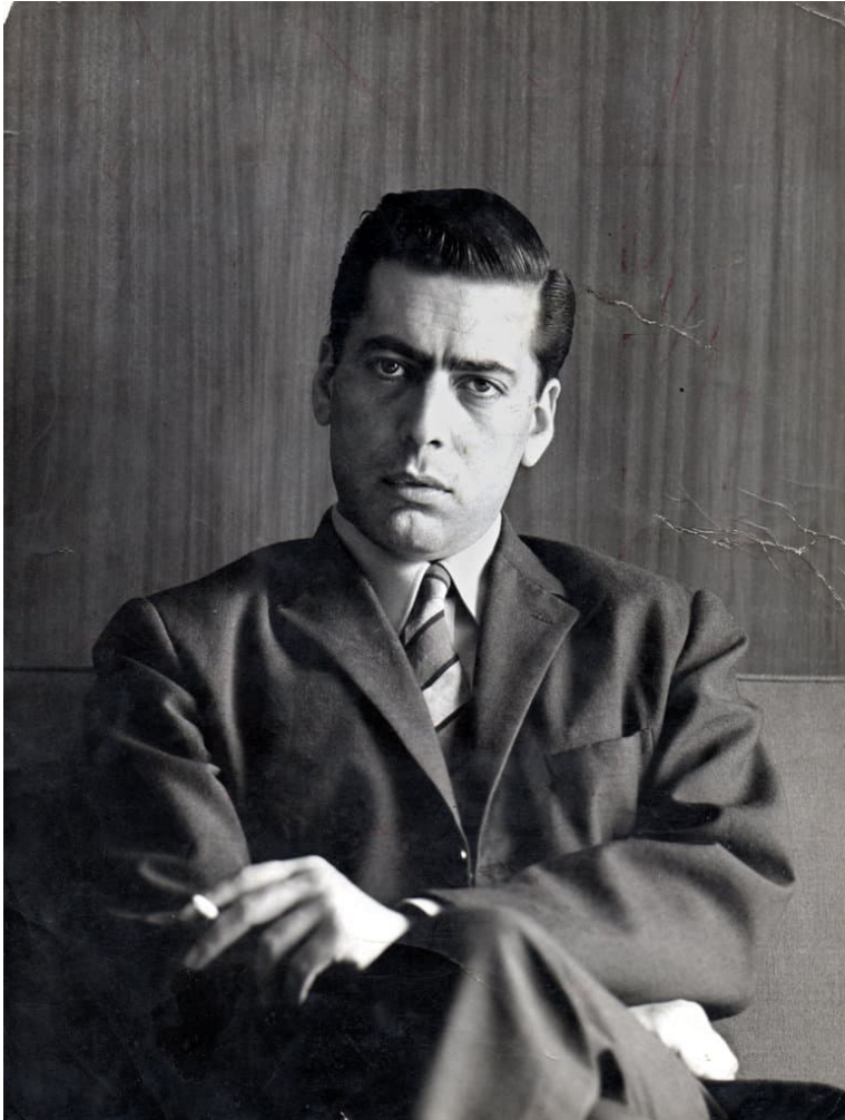
Mario Vargas Llosa en su juventud.

Después de dos años en la escuela militar, Vargas Llosa convenció a sus padres de que lo dejaran regresar a Piura para terminar sus estudios. Comenzó a escribir en diferentes géneros: periodismo, teatro y poesía. Regresó a Lima en 1953 para comenzar sus estudios de derecho y literatura en la Universidad Nacional Mayor de San Marcos. A partir de entonces, sus cuentos comenzaron a aparecer en las revistas literarias peruanas, y fue coeditor de Libros de composición (1956-57) y Literatura (1958-59). Trabajó como periodista y locutor y asistió a la Universidad de Madrid.