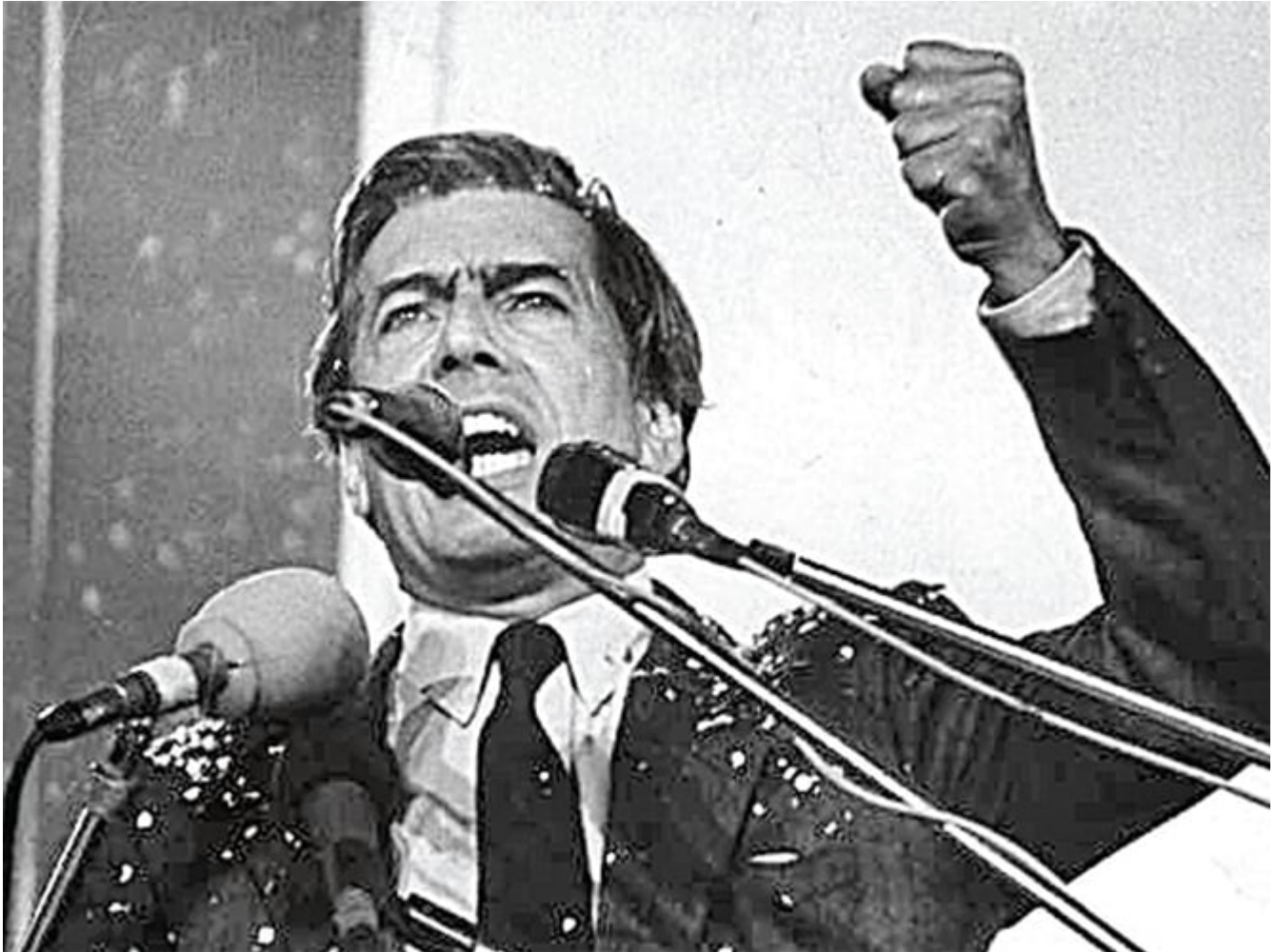
Mario Vargas Llosa durante su campaña presidencial en Perú 1990

En 1987, cuando el entonces presidente Alan García intentó nacionalizar los bancos del Perú, Vargas Llosa organizó protestas, ya que sentía que el gobierno también intentaría tomar el control de los medios de comunicación. Este activismo llevó a Vargas Llosa a formar el partido político Movimiento Libertad para oponerse a García. En 1990, se convirtió en el Frente Democrático, y Vargas Llosa se postuló a la presidencia ese mismo año. Perdió contra Alberto Fujimori, quien traería otro régimen autoritario a Perú. Fujimori fue finalmente condenado en 2009 por corrupción y violaciones a los derechos humanos y sigue cumpliendo condena en la cárcel. Vargas Llosa escribió sobre estos años en sus memorias de 1993 «Un pez en el agua».