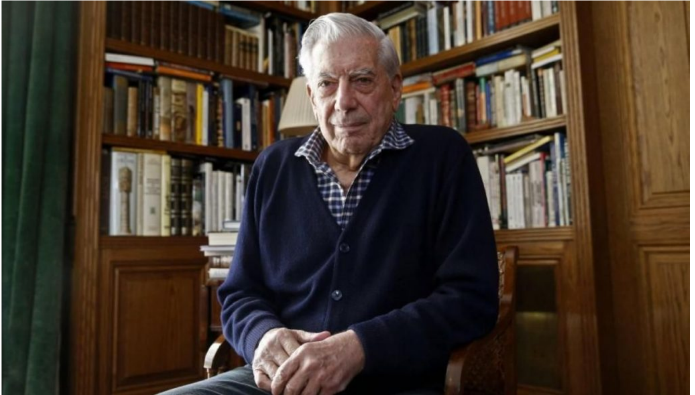
Mario Vargas Llosa (2019)

Vale la pena vivir, aunque fuera solo porque sin la vida no podríamos leer ni fantasear historias.