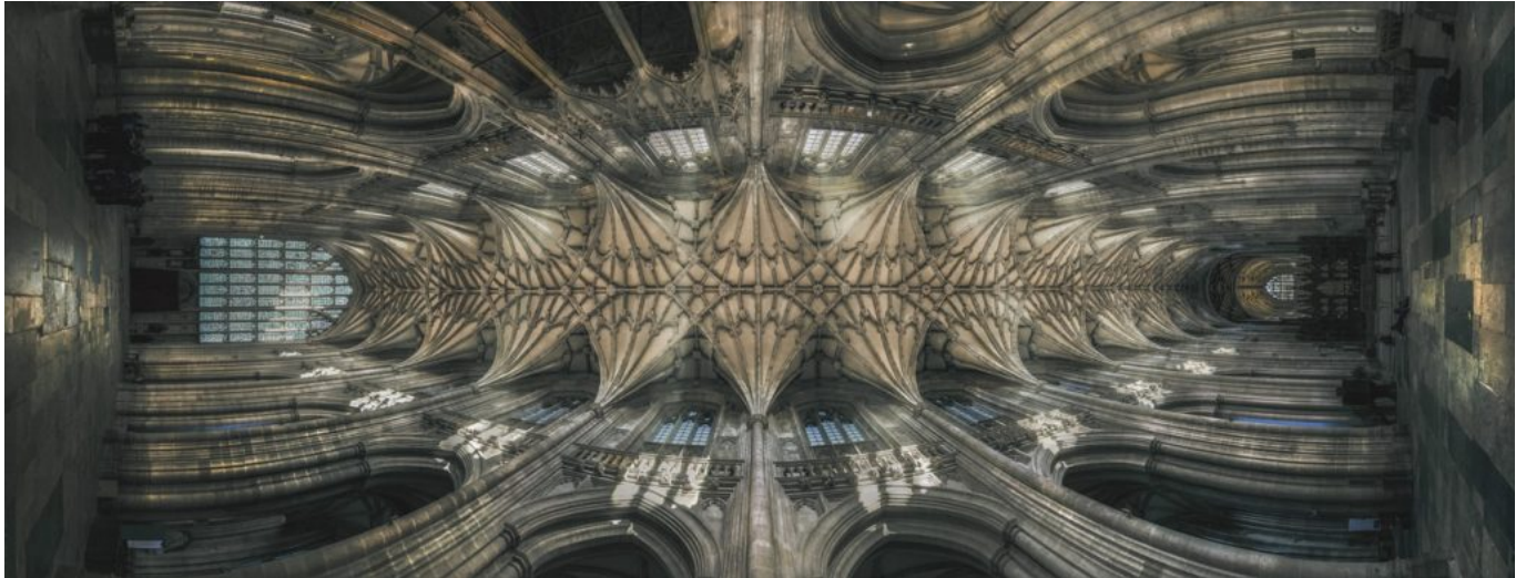
Las catedrales son una clara muestra de la arquitectura gótica