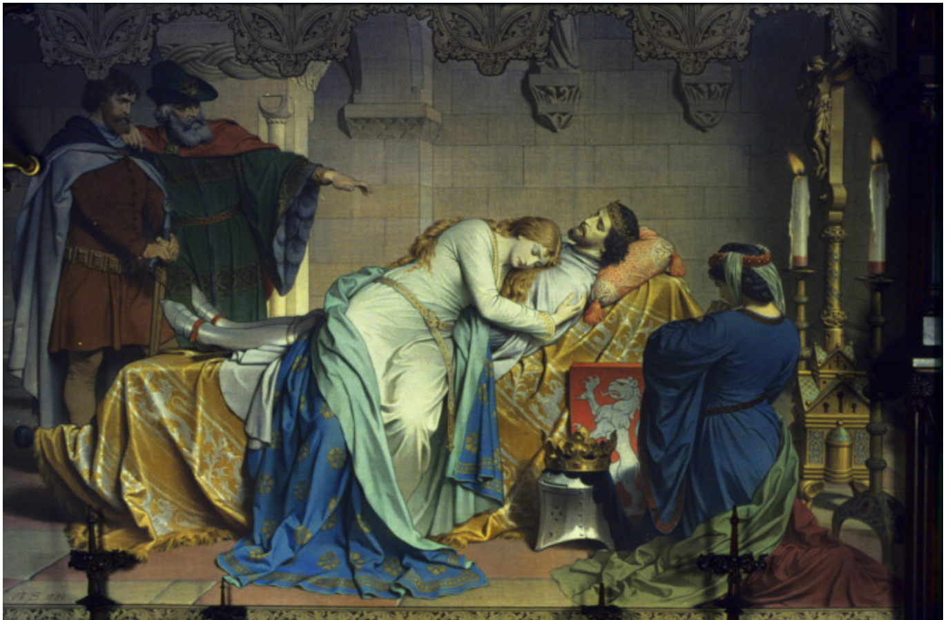
August Spiess, Reunión en la muerte de Tristán.

el llamado de la trompeta en el segundo acto de Sigfrido se cambia en El Crepúsculo de los Dioses de 6/8 a 4/4 veces, convirtiéndose en el tema del maduro y heroico Sigfrido. Más modificado en ritmo y textura, forma la base de la gran trama orquestal después de su muerte. De forma similar, en El Rin , la alegre canción de las doncellas del Rin sobre su tesoro se transforma cuando el tema representa el poder maligno del oro en las manos del enano Alberich.