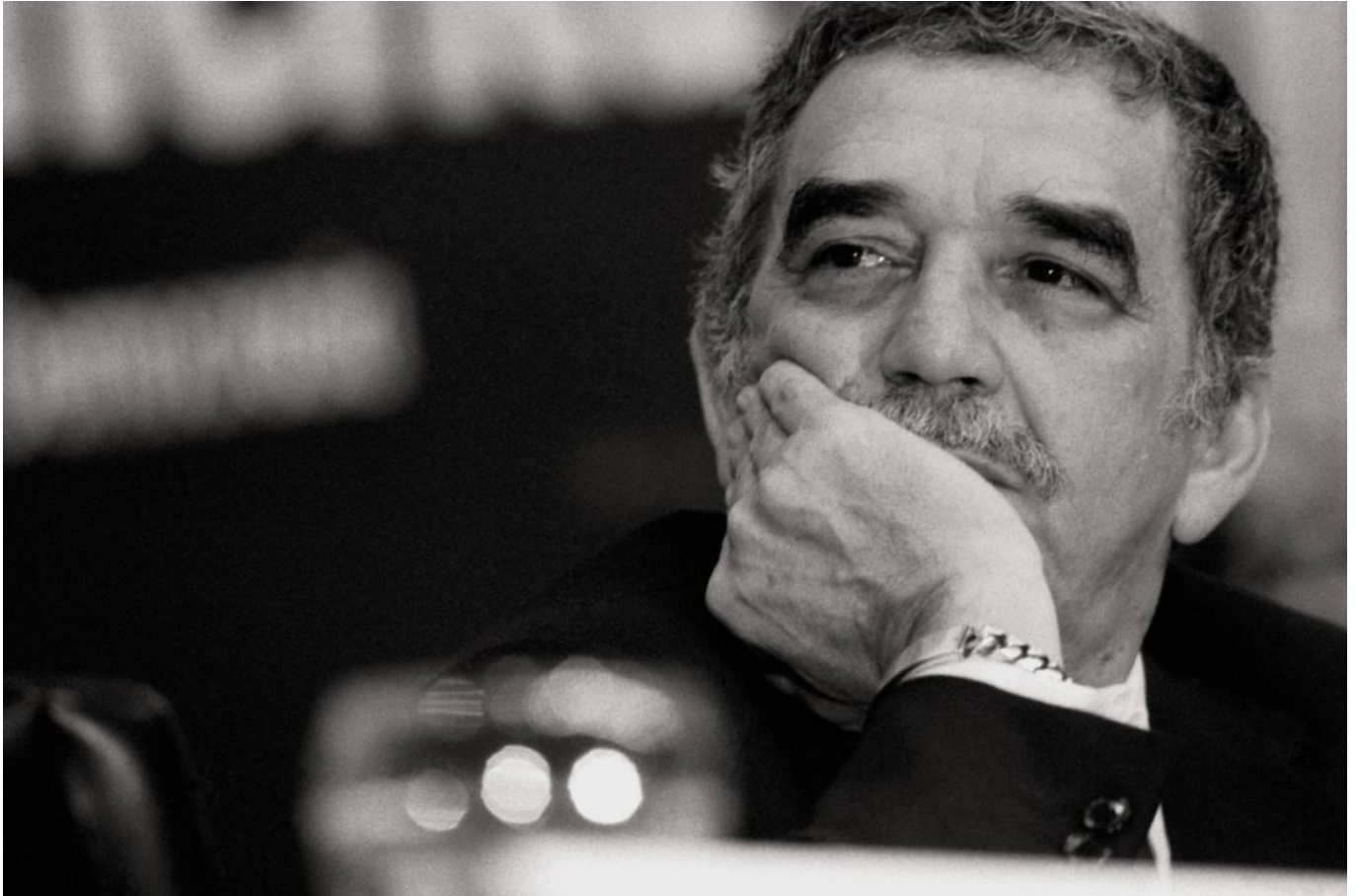
Gabriel García Márquez, autor de Cien años de soledad