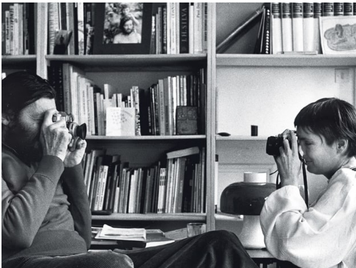
Julio Cortázar y Carol Dunlop

Hacia 1983 Cortázar hizo un viaje a su patria una vez se instaura nuevamente la democracia en Argentina. Por entonces ya había sufrido una hemorragia gástrica que casi le quita la vida, y también para esa época había muerto ya Carol Dunlop, una ex pareja del escritor. Tras la muerte de ella, Julio Cortázar se sumió en una gran tristeza.