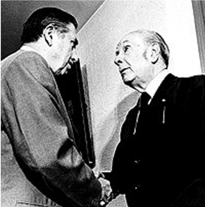
Borges y Augusto Pinochet

Personalmente, soy un lector hedonista ; nunca he leído un libro simplemente porque era antiguo. Leo libros por las emociones estéticas que me ofrecen e ignoro los comentarios y las críticas.