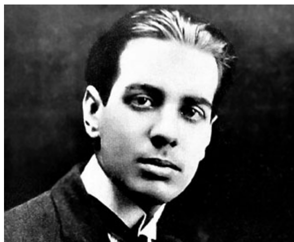
Jorge Luis Borges en su juventud

Bajo el constante estímulo y ejemplo de su padre, desde temprano el joven Borges reconoció que estaba destinado a una carrera literaria.