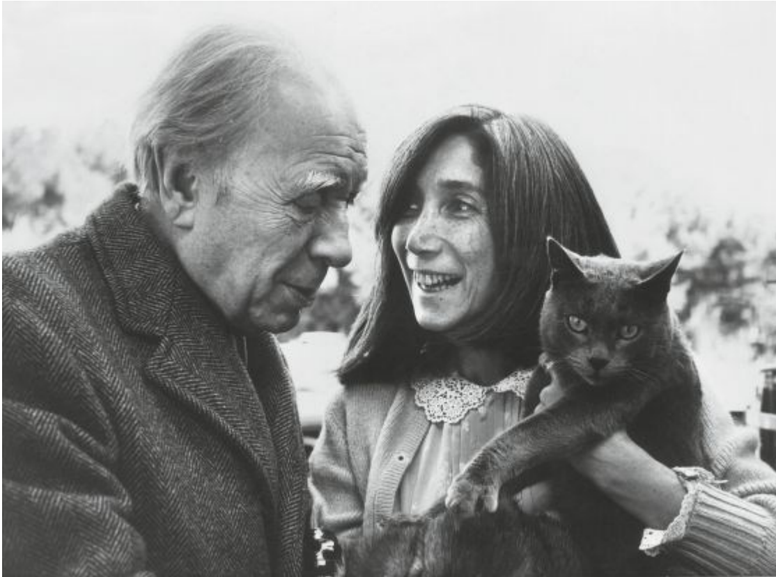
Jorge Luis Borges Maria Kodama

Ser inmortal es algo común; excepto el hombre, todas las criaturas son inmortales, porque ignoran la muerte ; lo que es divino, terrible, incomprensible, es saber que uno es inmortal.