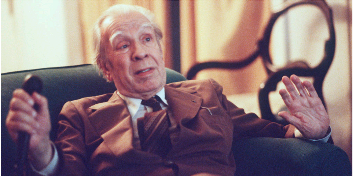
Jorge Luis Borges en su apartamento en Buenos Aires el 20 de noviembre de 1981.