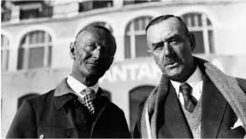
Hermann Hesse y Thomas Mann

Der Steppenwolf (1927; El lobo estepario) describe el conflicto entre la aceptación burguesa y la autorrealización espiritual en un hombre de mediana edad. En Narziss und Goldmund (1930; Narciso y Goldmundo), un asceta intelectual que se conforma con la fe religiosa establecida se contrapone a un sensualista artístico que persigue su propia forma de salvación.