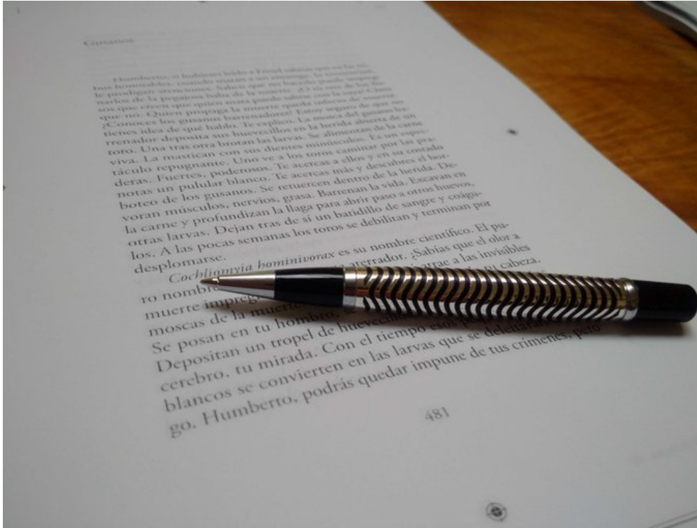
Última corrección «El salvaje»

La estructura de sus obras nunca son de forma lineal, ya que piensa que su obligación como contador de historias es encontrar la estructura adecuada y orgánica para relatarlas , ya que en la vida real nunca se cuentan las historias de manera cronológica, siempre se salta entre tiempos y temas.