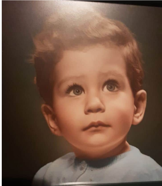
Guillermo Arriaga de niño

De niño era muy difícil que leyera un libro completo, ya que sufría de déficit de atención. Esto le ocasionó distintos problemas en la escuela e incluso llegó a pensar que necesitaba una escuela especial porque no lograba aprender.