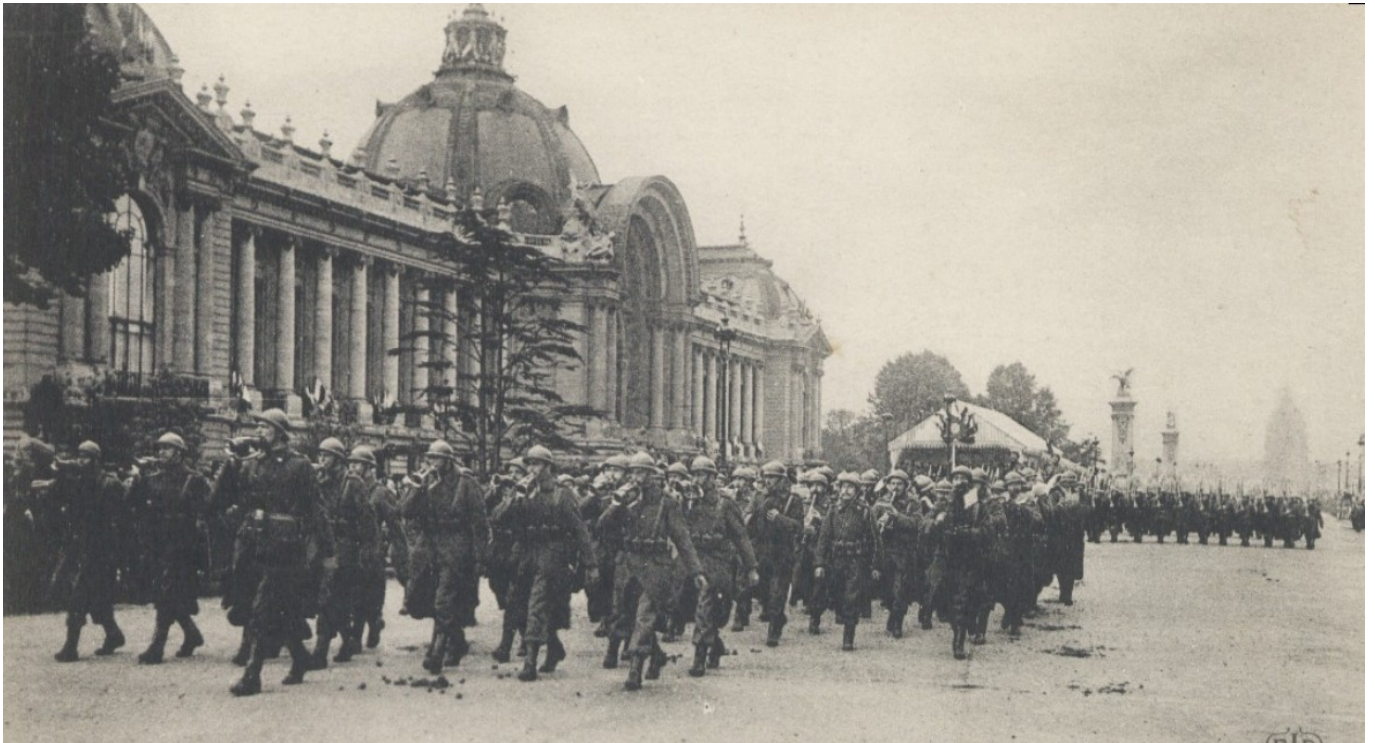
París durante la Primera guerra mundial

Con sus valores tan completamente destruidos por la guerra, los círculos de amigos americanos expatriados en Fiesta y París era una fiesta de Hemingway viven estilos de vida hedonistas y superficiales, vagando sin rumbo por el mundo mientras beben y festejan.