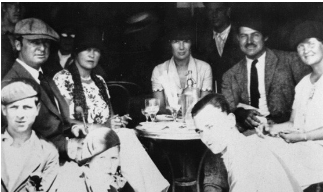
Hemingway y Fitzgerald en París.