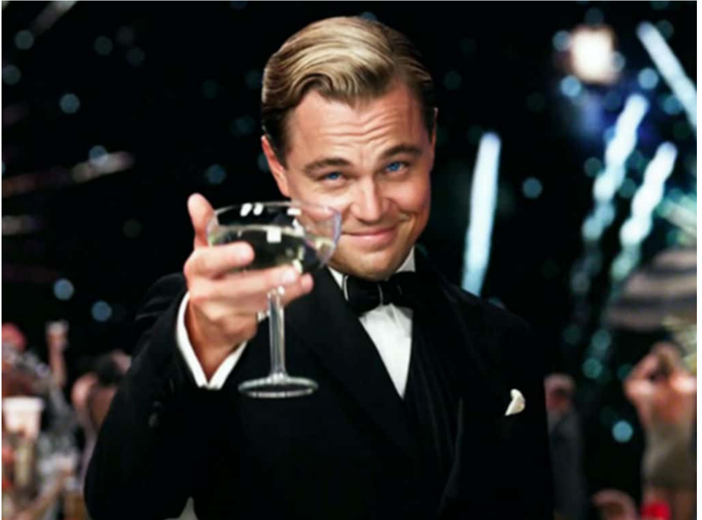
Leonardo di Caprio interpretó a El gran Gatsby (2013)