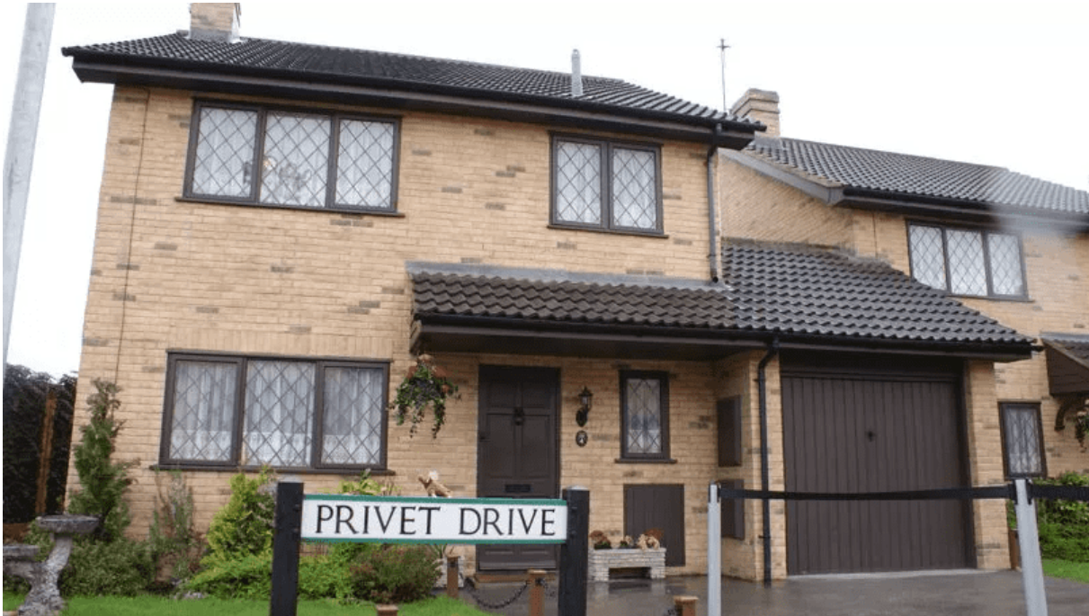
La casa de los Dursley en Privet Drive donde vivía Harry Potter