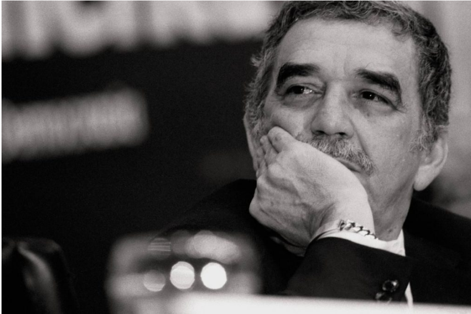
Gabriel García Márquez

□ Lee aquí más sobre el Realismo mágico en la literatura .