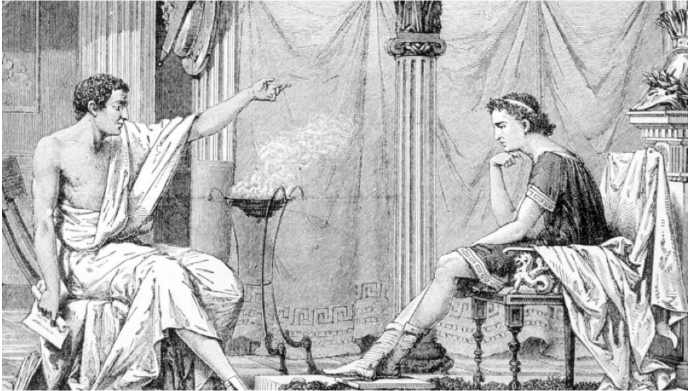
Aristóteles y su discípulo Alejandro Magno.